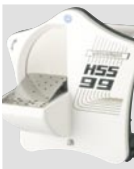
HSS-99 с наклонной подставкой