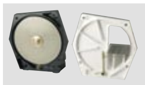
HSS-88 с наклонной приставкой