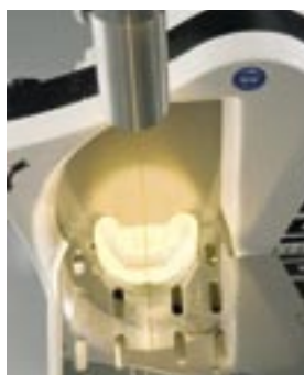
HSS-99 с специальными принадлежностями для ортодонтии