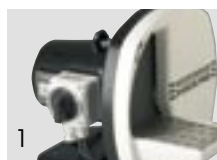
1 HSS-AZ (1-2)