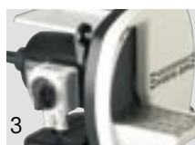
3 HSS-ZA (3-5)