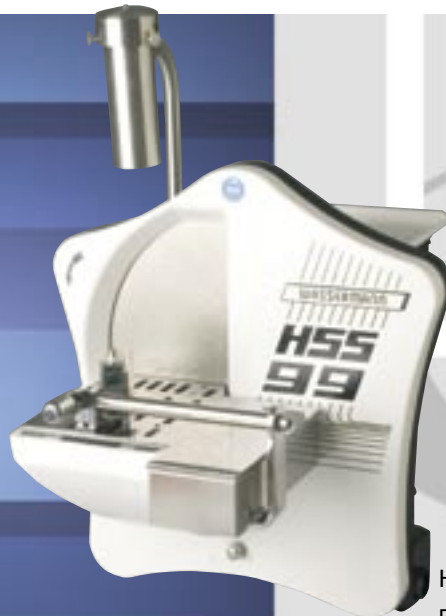
HSS-99 с специальными принадлежностями для ортодонтии