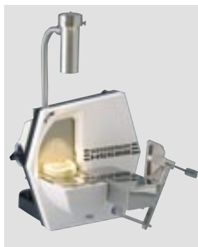
HSS-88 с оснащением для ортодонтии