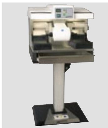
Автоматический штатив и WP-Ex 3000