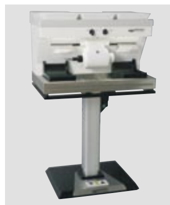
Автоматический штатив и WP-Ex 80