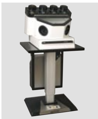
Автоматический штатив и Semat-NT 4 с отсасывающим устройством SG-1/2 D