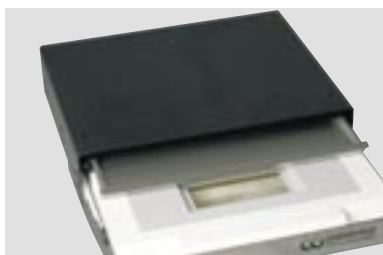
LSG-02 DE с промежуточным ящиком