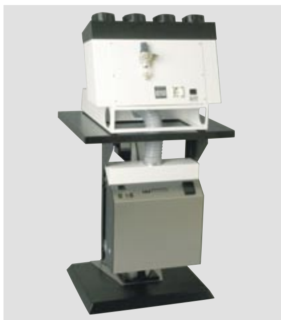
Пескоструйный аппарат Semat-NT 4, автоматический штатив с установленным отсасывающим устройством SG-1/2 D