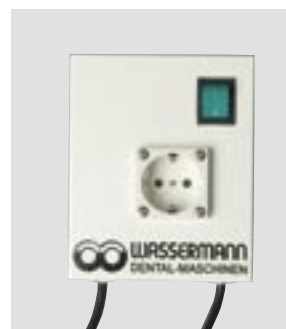
SG-1/1: AS-100 (автоматический запуск)