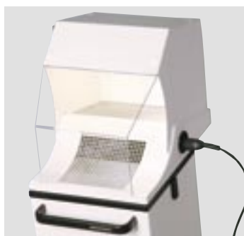
Timobil с колпаком отсасывающего устройства и подсветкой