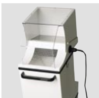
Timobil с колпаком отсасывающего устройства