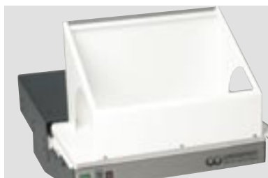
LSG-02 DE с универсальным колпаком