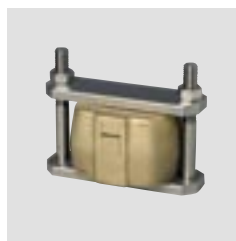
Универсальный зажим для кювет