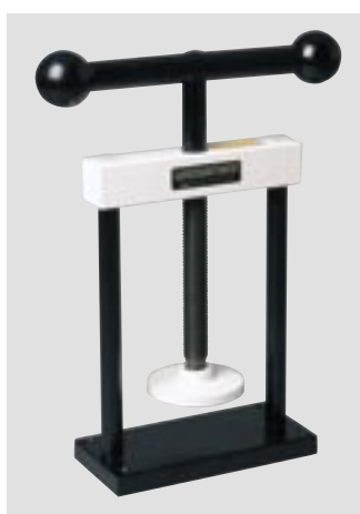
Стальной пресс на 1-3 кюветы