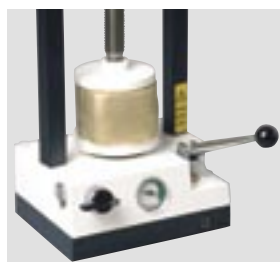
WW-33 на 1-3 кюветы